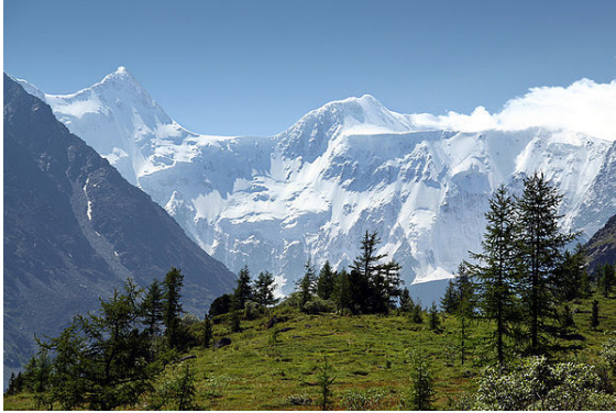
Altay Dağları bu dil ailesine adını vermiştir.

Kimi dilbilimcilerce Estonca, Fince ve Macarca gibi Ural dillerinin de bir Ural-Altay dil ailesinin parçası olarak bahsi geçen Altay dillerinin uzaktan akrabaları olduğu savunulmaktaysa da, [1] bu görüş dünya dilbilimcileri tarafından genel kabul görmemiştir.